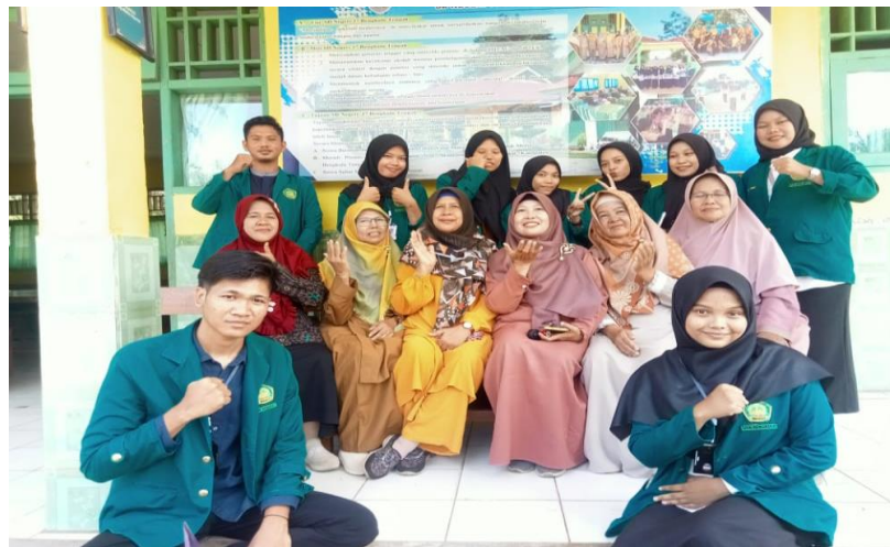
FOTO: SILATURAHMI BERSAMA KEPALA SEKOLAH DAN GURU SDN 37 DESA SRIKATON