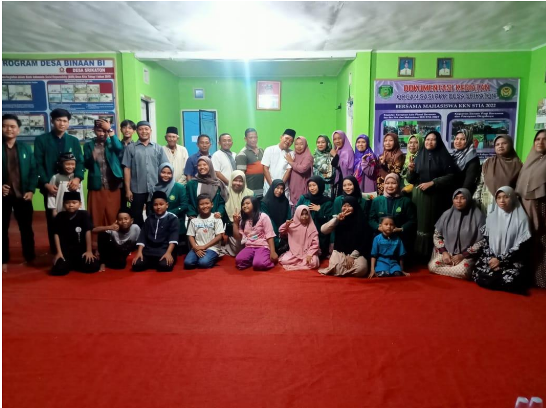
FOTO: MALAM PERPISAHAN BERSAMA PERANGKAT DESA DAN WARGA