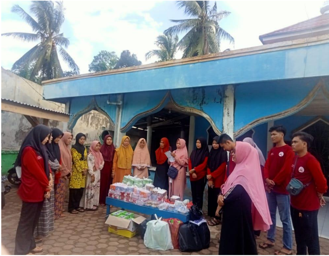
FOTO: PEMBAGIAN TAKJIL YANG DILAKUKAN OLEH IBU IBU PENGAJIAN MASJID NURUL HUDA DESA SRIKATON