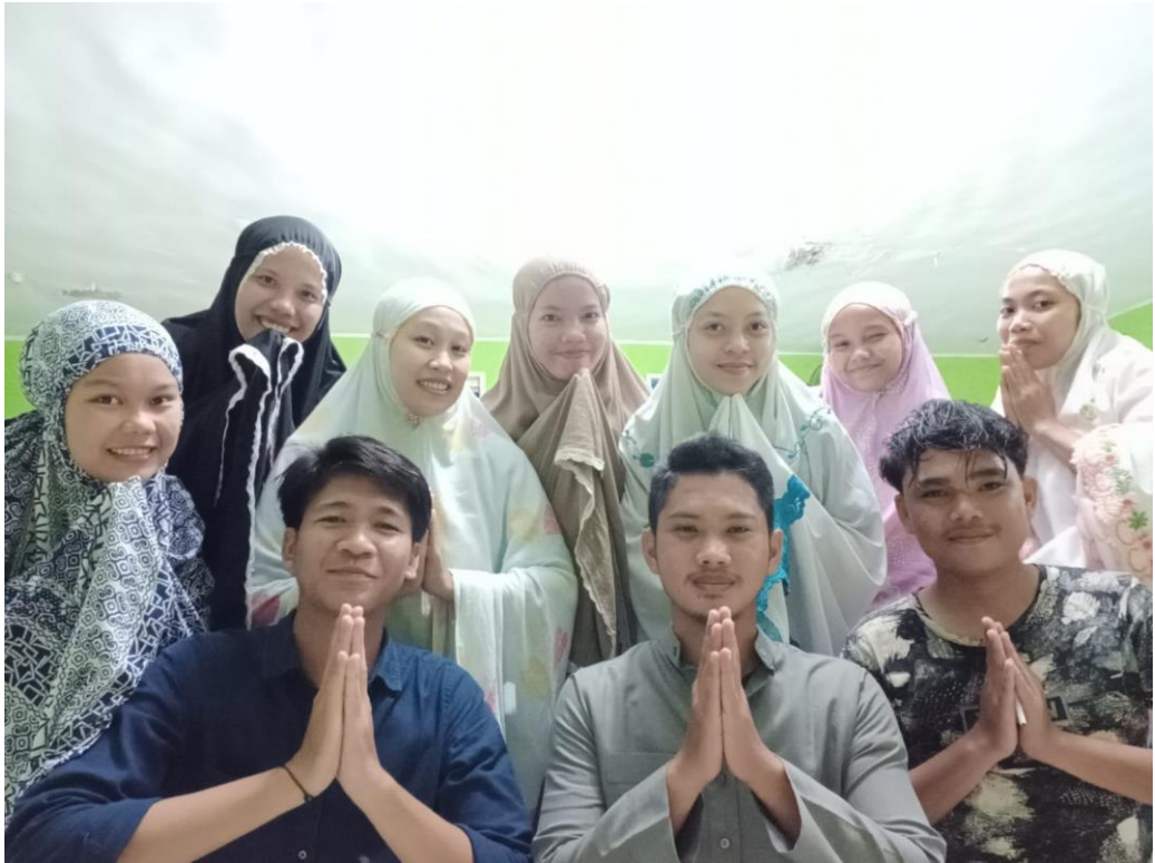
FOTO: ANGGOTA KKN 93 UINFAS BENGKULU DI BALAI DESA SRIKATON