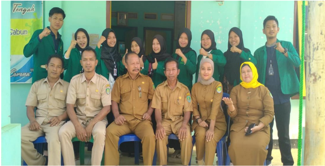
FOTO: SILATURAHMI BERSAMA PERANGKAT DESA SRIKATON DAN PEMAPARAN PROGRAM KERJA