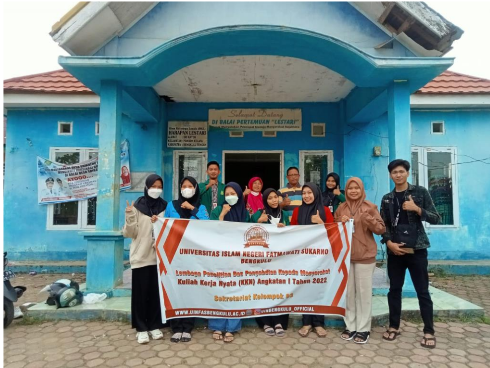
FOTO: PENYERAHAN MAHASISWA KKN KELOMPOK 93 BERSAMA SEKDES