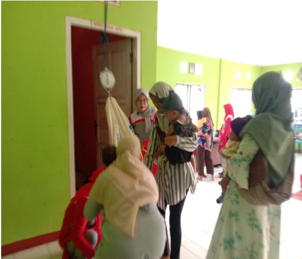
FOTO: KEGIATAN POSYANDU BALITA YANG DIADAKAN 1 BULAN SEKALI DI BALAI DESA SRIKATON