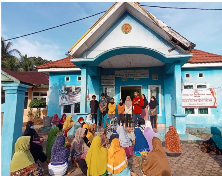
FOTO: BERKENALAN ANGGOTA KKN KELOMPOK 93 DENGAN IBU IBU LANSIA DESA SRIKATON