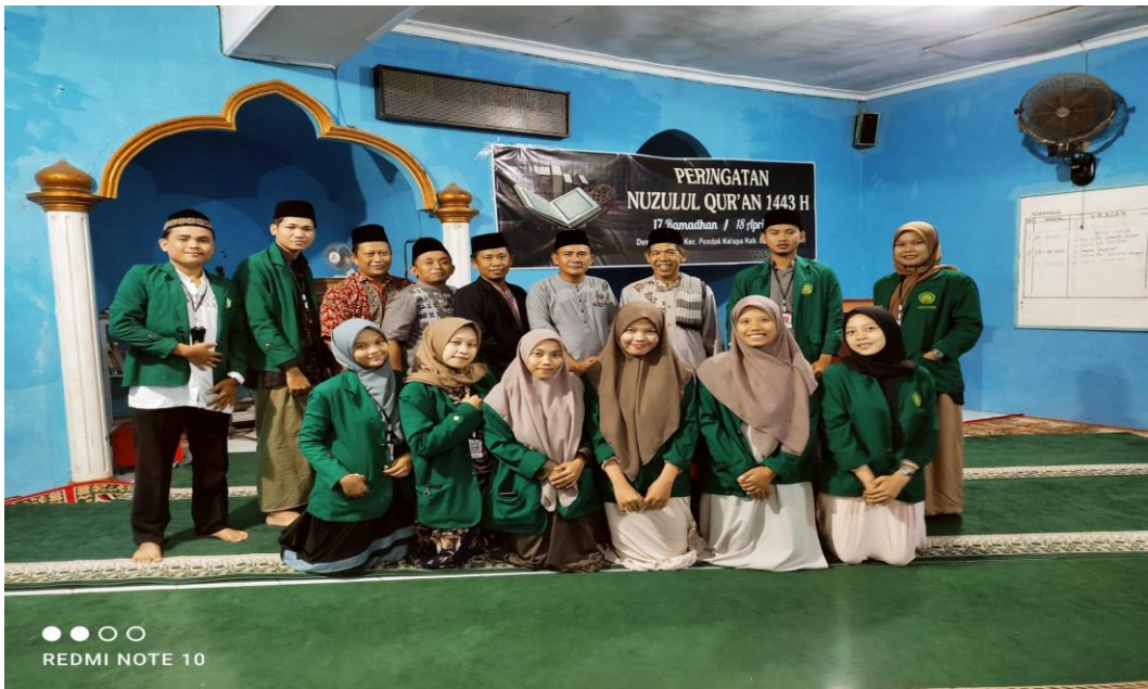
FOTO: ACARA PERINGATAN MALAM NUZUL QUR'AN DI MASJID NURUL HUDA DESA SRIKATON