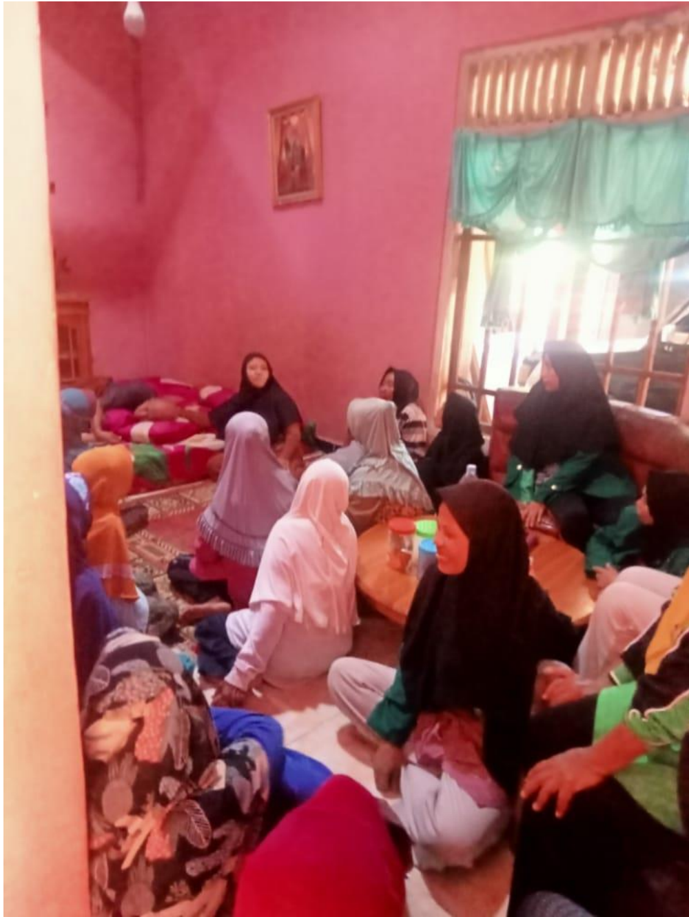
FOTO: MENGUNJUNGI WARGA DESA YANG SEDANG SAKIT