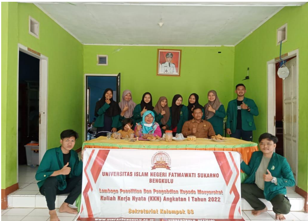
FOTO: PENARIKAN MAHASISWA KKN 93 UINFAS DESA SRIKATON