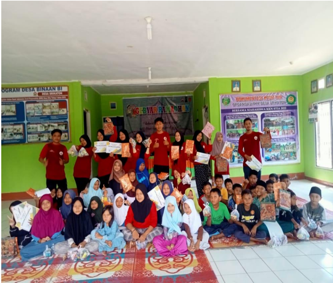
FOTO: PEMBAGIAN HADIAH GEBYAR RAMADHAN DI BALAI DESA SRIKATON