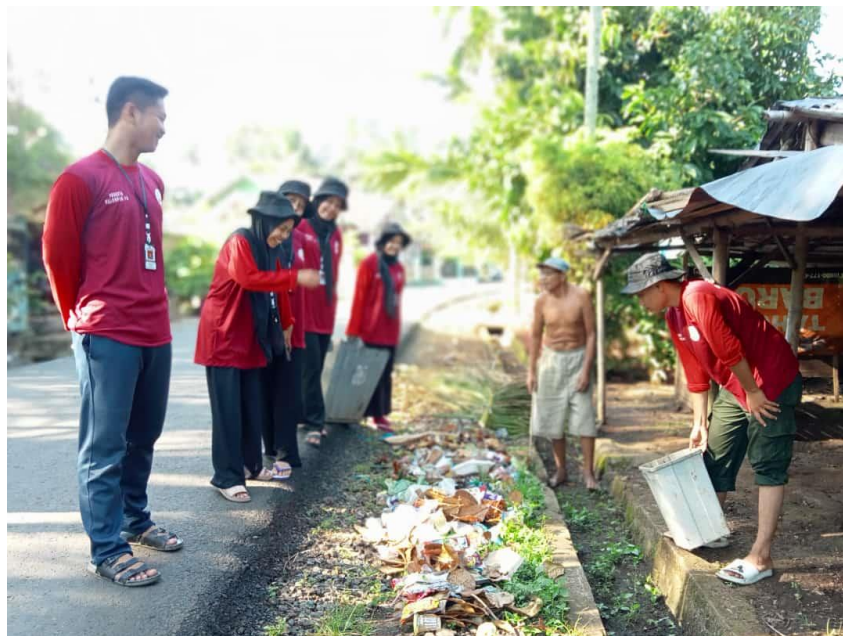
FOTO: GOTONG ROYONG BERSAMA DI DESA SRIKATON