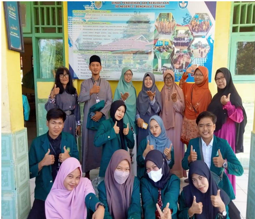
FOTO: BERSAMA GURU DAN KEPALA SEKOLAH SELEPAS ACARA NUZUL QUR`AN / PESANTREN KILAT DI SDN 37 DESA SRIKATON