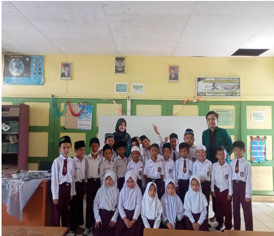
FOTO: PESANTREN KILAT BERSAMA SISWA DAN SISWI SDN 37 DESA SRIKATON