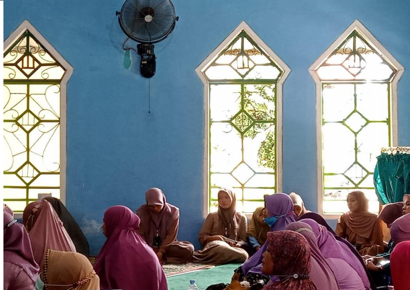
FOTO: KEGIATAN BERSAMA IBU IBU SALIMAH CABANG BENGKULU TENGAH DI MASJID NURUL HUDA DESA SRIKATON