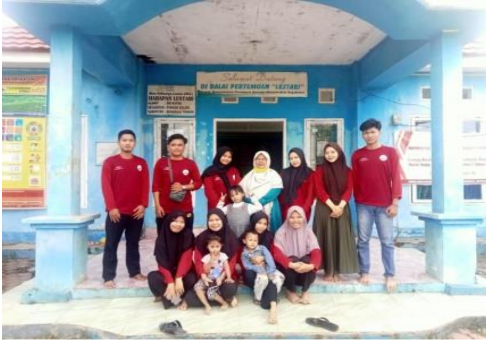
FOTO: MONITORING BERSAMA DOSEN PEMBIMBING LAPANGAN