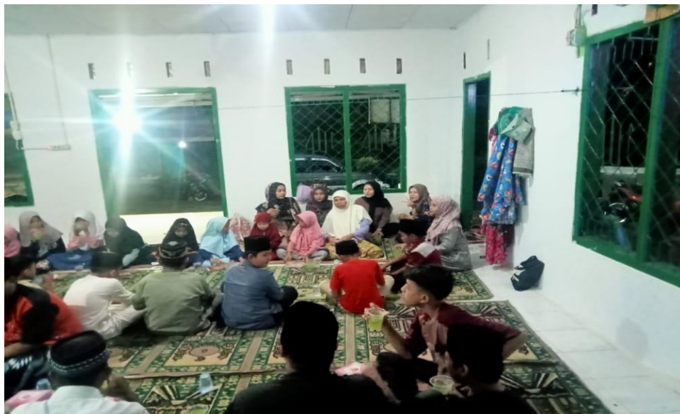
FOTO: BUKA PUASA BERSAMA PERANGKAT DESA DAN KADUN I SERTA PEMBAGIAN HADIAH LOMBA DI MUSHOLLAH AS-SAKINAH, DUSUN I DESA SRIKATON