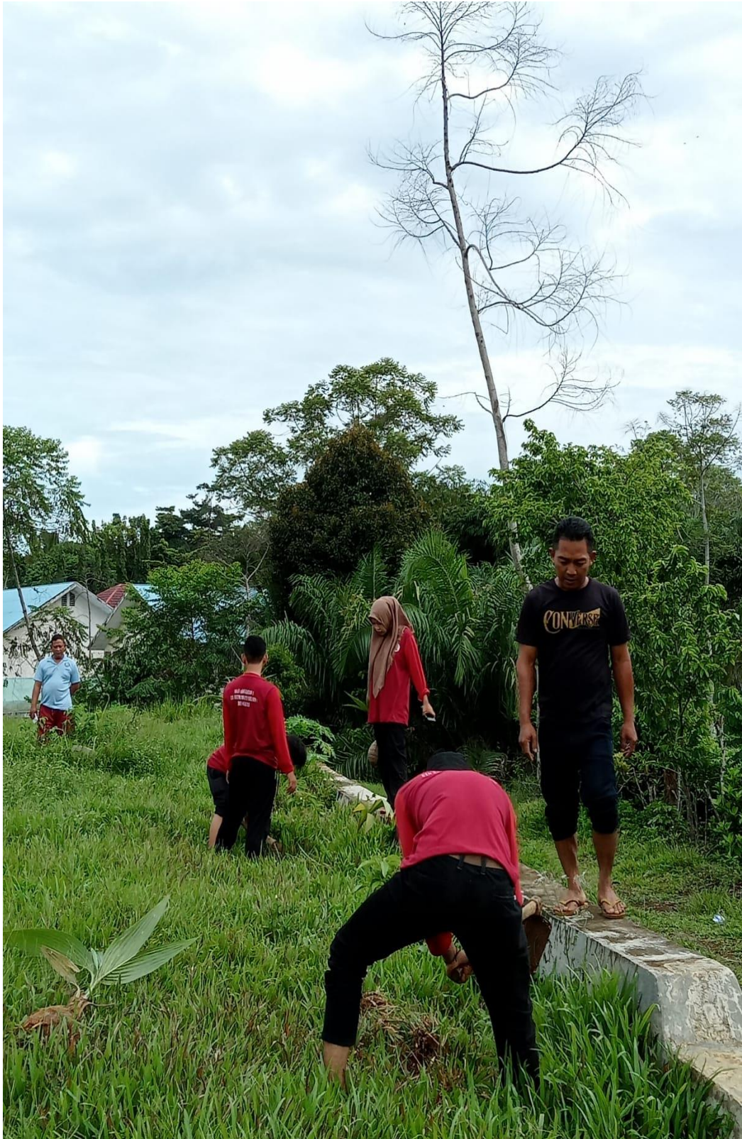
FOTO: PENANAMAN BIBIT KELAPA DI DESA SRIKATON