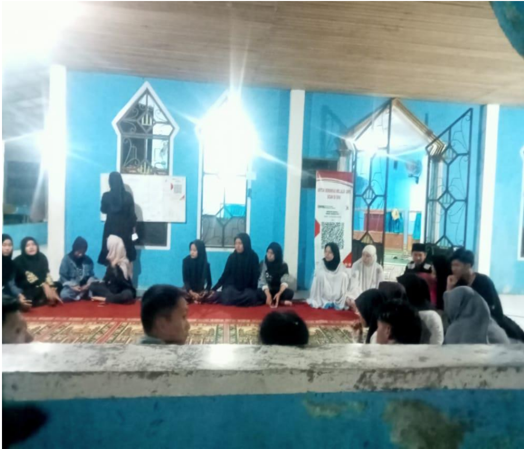
FOTO: BUKA PUASA BERSAMA PERANGKAT DESA DAN RISMA DESA SRIKATON