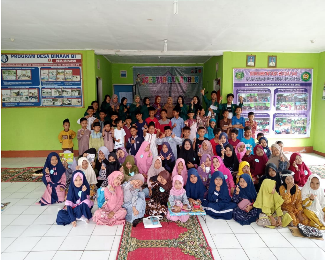
FOTO: ACARA GEBYAR RAMADHAN 2022 DI DESA SEIKATON