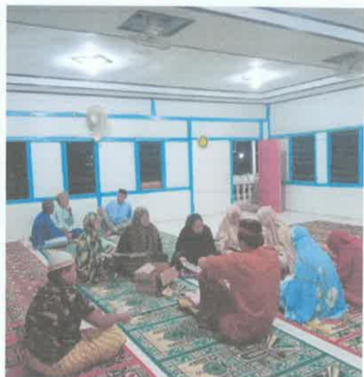
• Mengajar Mengaji Anak-anak desa Lubuk Sini