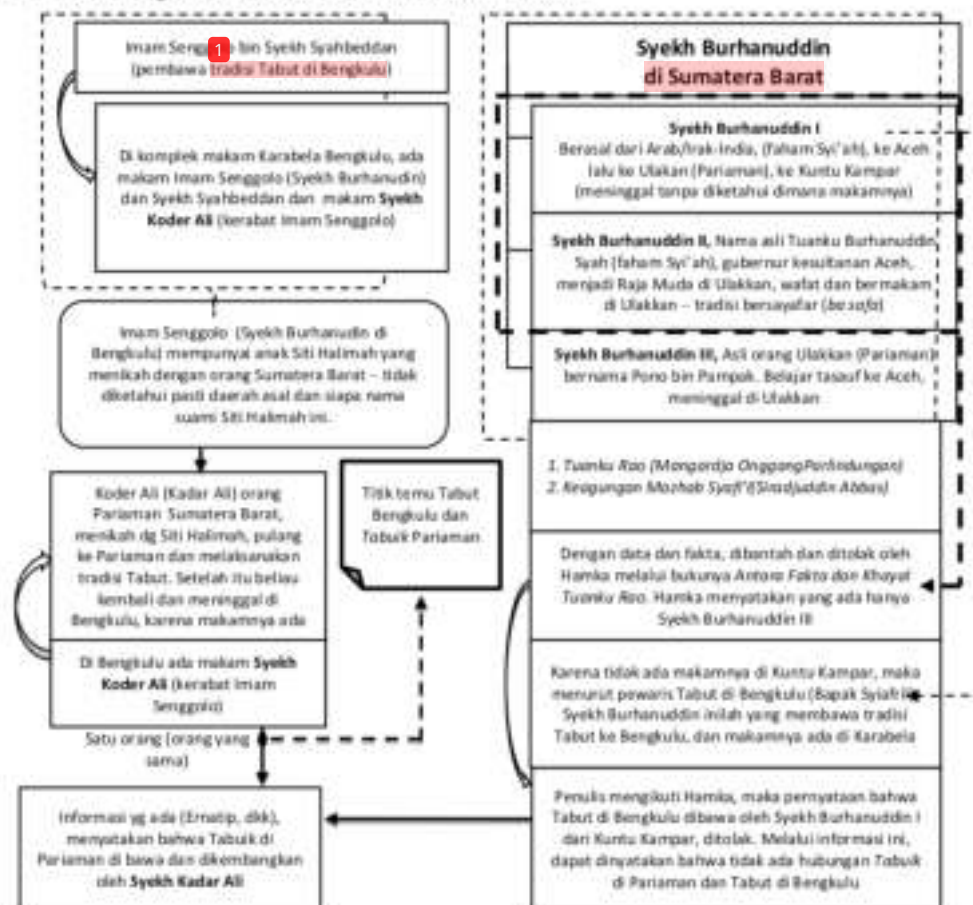
Gambar 2. Silsilah dan keterkaitan Tabut Bengkulu dan Tabuik Pariaman