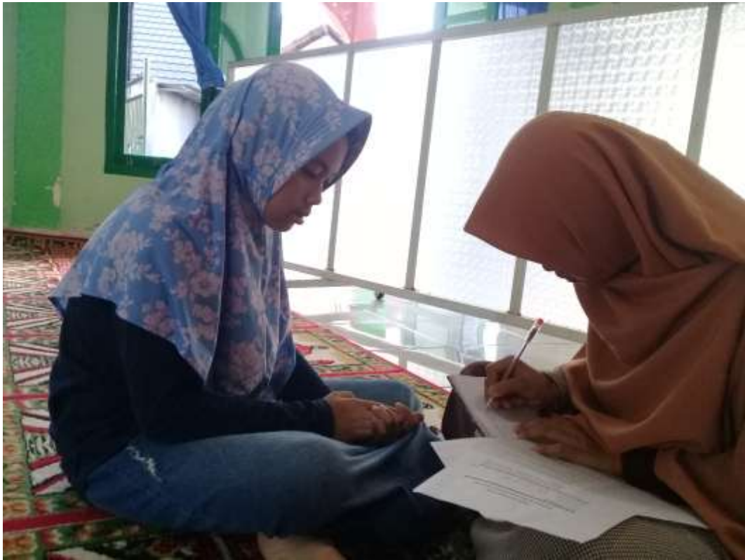
Foto Bersama Santri