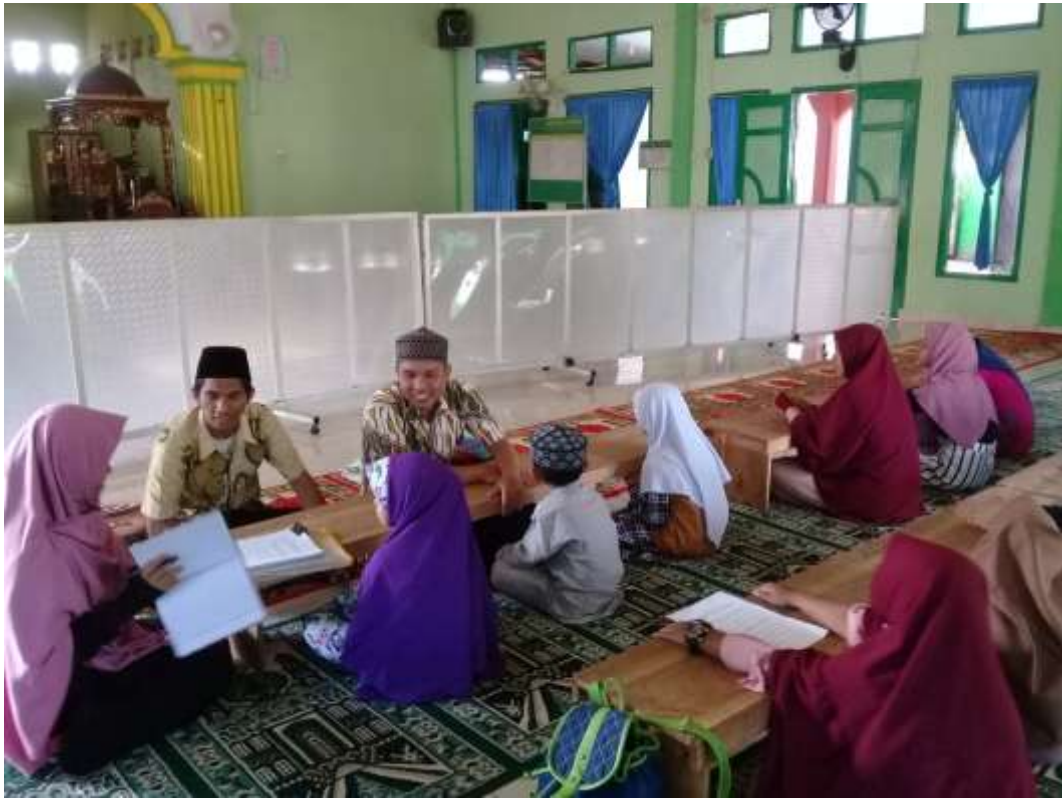
Wawancara dengan Ketua TPQ