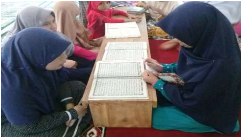
Gambar 4.1 Santri yang sedang membaca Al-Qur'an

adalah salah satu untuk peningkatan anak dalam membaca Al-Qur'an karena di dalam membaca Al-Qur'an haruslah tepat terutama mengenai makhorijul huruf dan hukum tajwid. Di TPQ ini guru mengajarkan tentang makhorijul huruf dan hukum tajwid tidak ada waktu khusus dalam mengajarkannya hanya ketika anak mengaji guru baru memberitahukan terutama ketika anak tidak benar dalam membaca Al-Qur'an. 73 Hal ini diperkuat dengan melihat langsung santri didalam membaca Al-Qur'an. Seperti gambar: