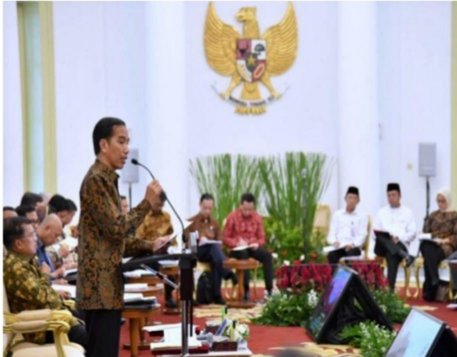
(Presiden Joko Widodo dalam pidatonya tanggal 1 Juni 2016) 64

Pancasila sebagai ideologi negara dan Bangsa Indonesia menjadi jiwa dan semangat juang bangsa Indonesia dalam menjaga, memajukan dan menegakkan keutuhan Negara Kesatuan Republik Indonesia (NKRI). Pancasila menjadi jiwa raga bangsa Indonesia yang dalam segala gerak gerik kita seharusnya menjadi ruh untuk membangun kemajuan bangsa dan negara. Semangat kebangsaan Indonesia harus terus dijaga dan dikembangkan dalam menghadapi berbagai masalah aktual bangsa Indonesia yang saat ini menghadapi tantangan arus budaya dan ideologi luar yang tidak jarang membawa efek negatif, misalnya ideologi radikalisme keagamaan, budaya hedonisme, dan budaya liberalisme-kapitalisme. Oleh sebab itu, semangat persatuan dan kesatuan bangsa Indonesia yang terbangun dari berbagai suku, bahasa, ras, etnis, agama dan