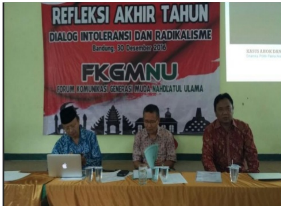
(Deputi IV Kantor Staf Presiden RI, Eko Sulistiyo)

Sebagai ormas Islam terbesar di Indonesia yang telah teruji sikap kenegarawanannya, Nahdlatul Ulama diharapkan menjadi penjaga Negara Kesatuan Republik Indonesia, terutama dalam menangkal potensi intoleransi dan radikalisme yang diperkirakan terus menguat pada 2017 ini. Pernyataan itu disampaikan Deputi IV Kepala Staf Kepresidenan Eko Sulistyio dalam refleksi akhir tahun di Kantor Pengurus Cabang Nahdlatul Ulama (PCNU) Kota Bandung, di Jalan Sancang, kawasan Lengkong, Bandung..... peran penting NU dalam sejarah perpolitikan negeri ini yang terbukti berperan penting menjaga kesatuan Indonesia dan meredam radikalisme. Pertama, terkait orientasi politik ideologis, ditunjukkan dengan langkah NU menerima Pancasila sebagai ideologi final. Kedua, terkait orientasi keagamaan, secara teologis dan psikologis, melalui pendekatan dialogis dengan bekal teologi ahl al-sunnah wa