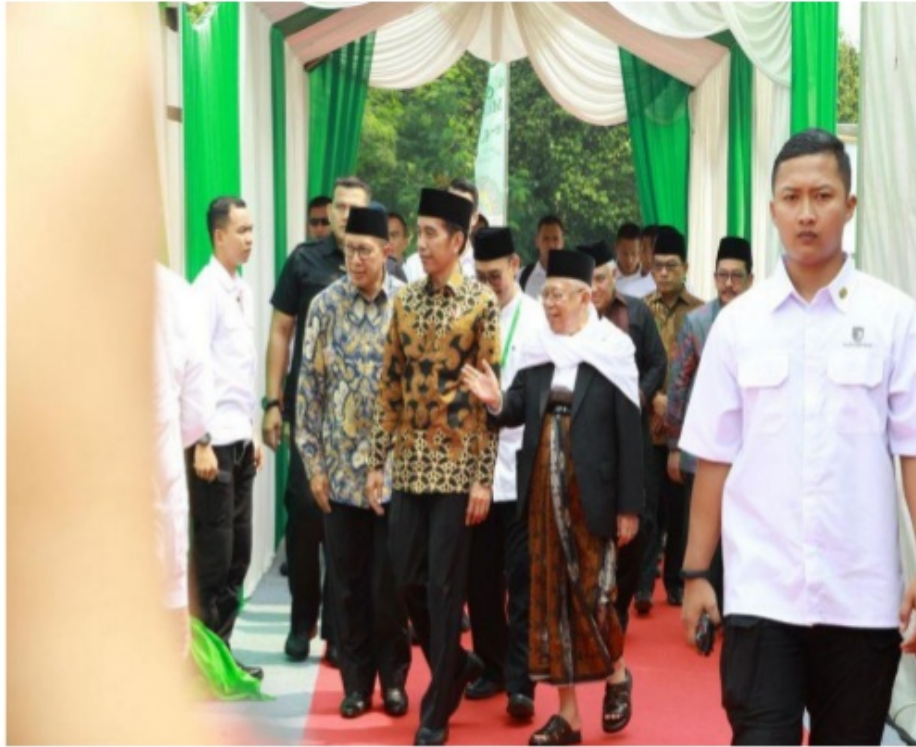
(Presiden tiba di tempat acara Majelis Ulama Indonesia (MUI) dijemput oleh Menteri Agama dan Ketua Umum MUI pada Tasyakur Milad ke-43 MUI di Jakarta) 282

Sebagai seorang tokoh agama, Lukman Hakim Saifuddin memiliki jiwa dan pandangan yang inklusif terhadap semua aliran keagamaan. Lukman meyakini bahwa semua ajaran agama pasti memiliki nilai-nilai yang bertujuan meningkatkan harkat dan martabat manusia, sehingga nilai-nilai universal ini yang hendaknya dijadikan pijakan dasar dalam membangun kerjasama kemanusiaan dan kebangsaan. Sikap dan pandangan inklusif Lukman tidak lepas dari profilnya sebagai tokoh agama yang berlatar belakang NU yang memiliki komitmen terhadap penerimaan Pancasila sebagai ideologi yang sejalan dengan agama Islam dan kedua-duanya harus dijadikan