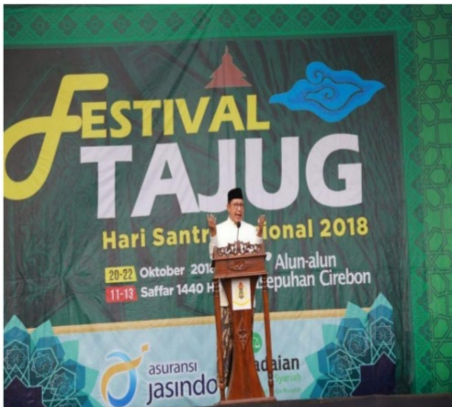
(Menag Tutup Festival Tajug Cirebon) 144

ijtihad berlandaskan pada argumentasi realitas empiris sebagaimana praktik ijtihad mashlahah, sehingga kegiatan ijtihad ini dibangun untuk mengamati, meneliti, memikirkan dan mempelajari realitas empiris sebagaimana diperintahkan untuk mengamati alam semesta. Kedua, paradigma ijtihad yang berlandaskan pada argumentasi rasional sebagaimana praktik qiyas. 143