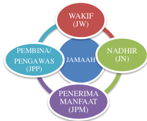
Gambar D.3 Skema kaFUangMas (wakaf uang masjid)

Fungsi masjid adalah sebagai tempat pembinaan umat atau dengan kata lain untuk pelaksanaan ibadah mahdah dan ghairu mahdah . Pemahaman tentang ini menjadi dasar utama untuk suksesnya skema yang penulis tawarkan. Yaitu skema kaFUangMas (wakaf uang masjid). Skema ini digambarkan sebagaimana dalam gambar C.3 berikut: