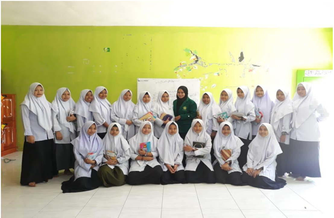
صورة مع طلبة الصف الثامن