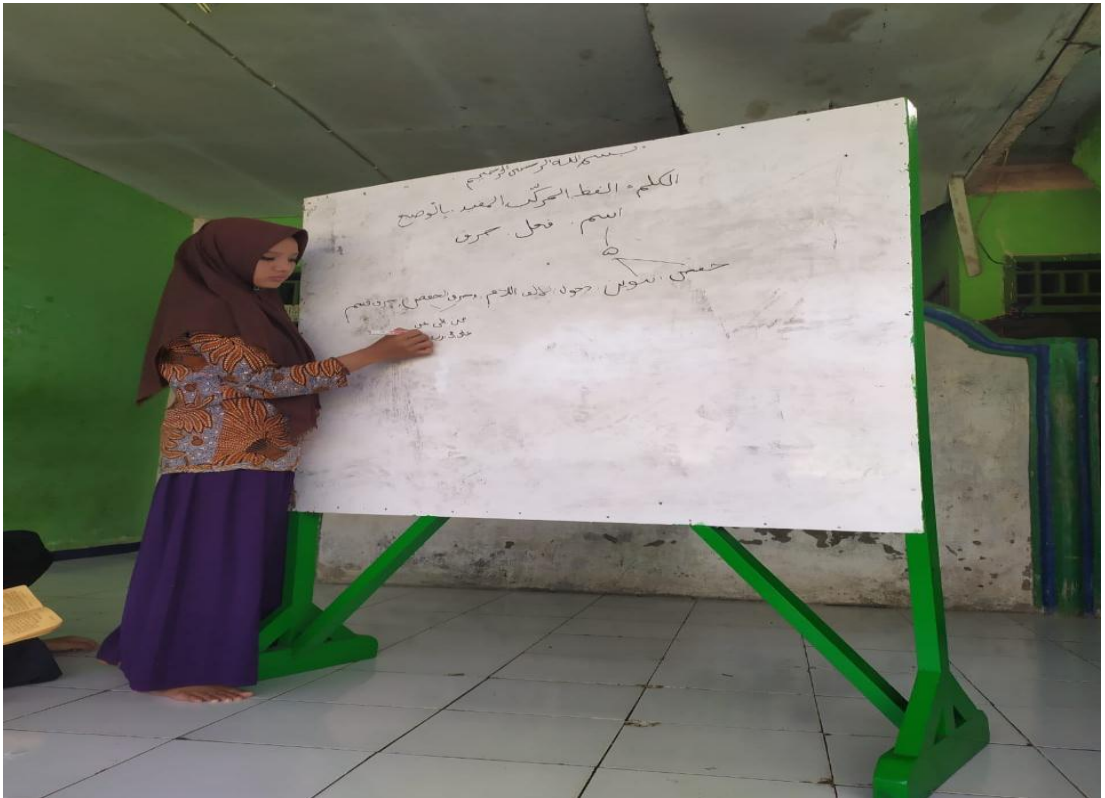
صور من أنشطة مناقشة الفصل التجريبي التاسع