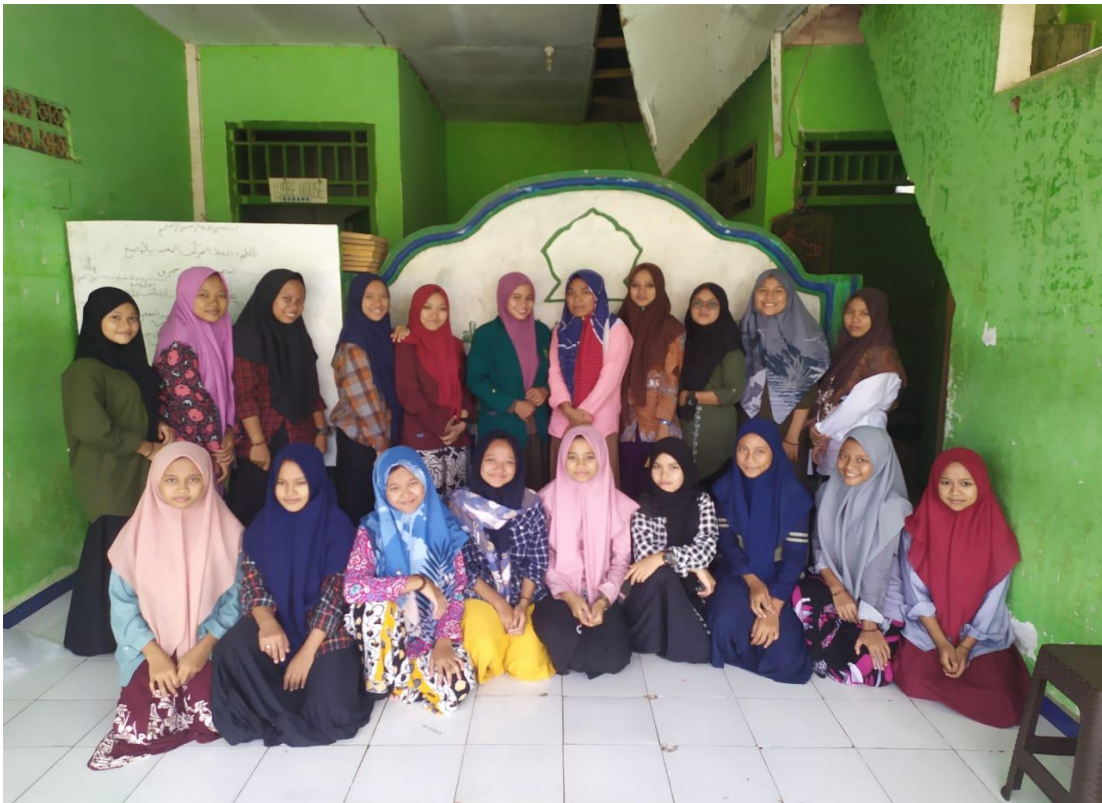
صورة مع طلبة الفصل التاسع