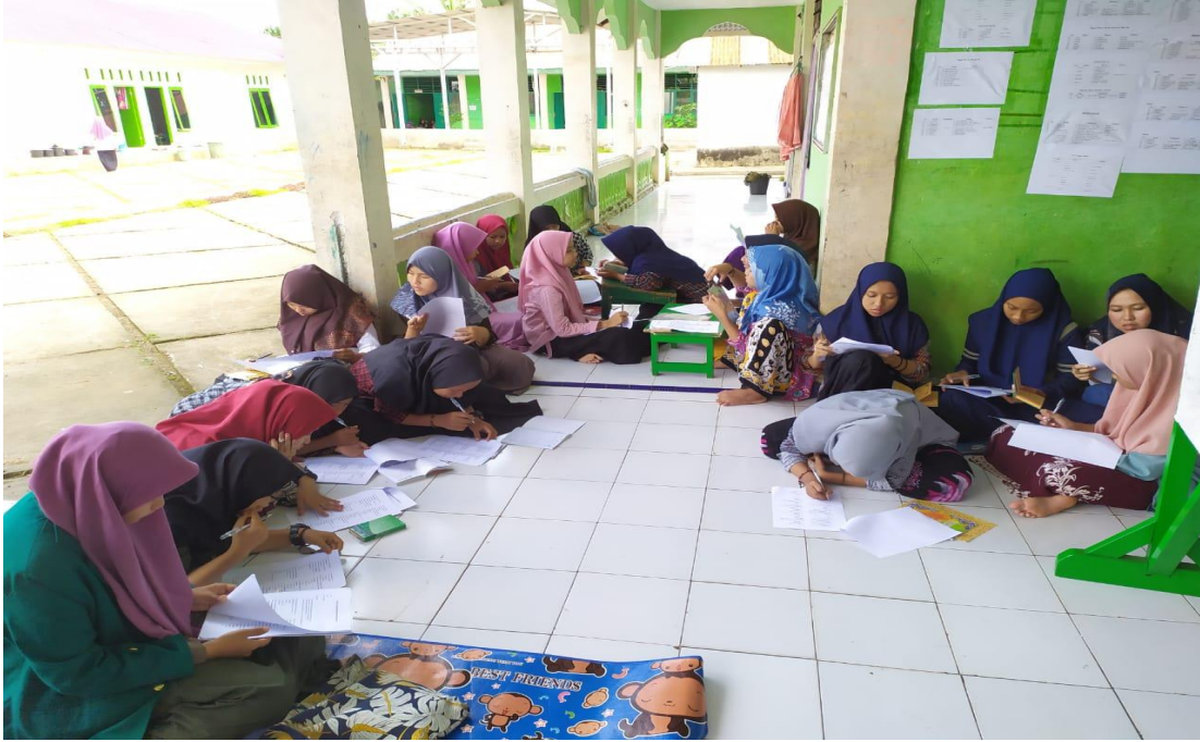
صورة لملء أسئلة الاختيار من متعدد للصف التاسع التجريبي