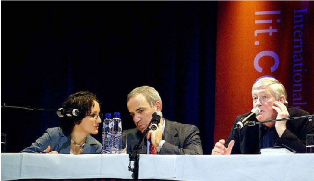
Sumber Stefanny Dodd dalam bukunya How to Become Interpreter , 2012

Dalam gambar di atas terlihat bahwa proses consecutive atau berurutan terjadi. Penutur bahasa asli berada di sebelah kanan, dia menyampaikan pesan/pidato kepada audience. Sementara itu interpreter bertugas menginterpretasi pesan kepada orang kedua yang non penutur asli sehingga dapat memahami apa yang dimaksud penutur asli. Aksi berikutnya pun sebaliknya non penutur asli menyampaikan pesan/pidato kepada audience dengan menggunakan bahasa kuasanya lalu kemudian sang interpreter menyampaikan juga interpretasinya kepada penutur asli sehingga dapat dipahami juga olehnya.