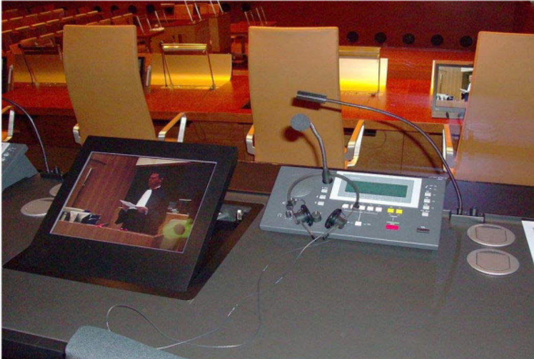
Sumber Stefanny Dodd dalam bukunya How to Become Interpreter , 2012