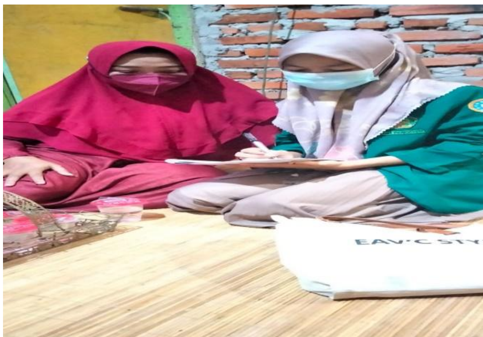
Ket. Gambar 12: wawancara dengan orang tua peserta didik SDN 78 Kota Bengkulu