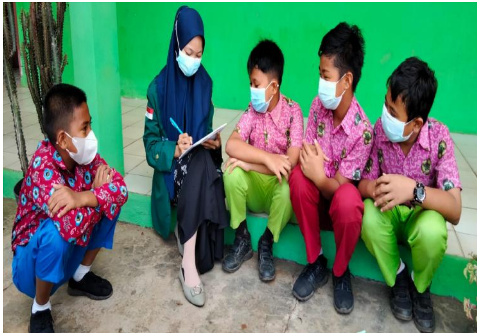
Ket. Gambar 5: Wawancara dengan peserta didik SDN 78 Kota Bengkulu