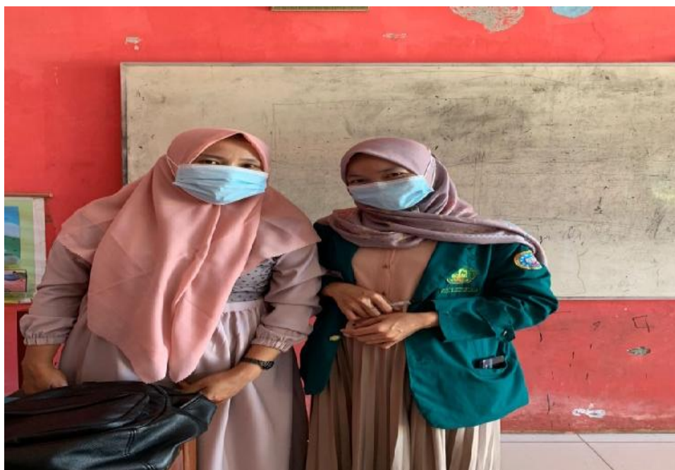
Ket. Gambar 4: Wawancara dengan ibu guru di SDN 78 Kota Bengkulu