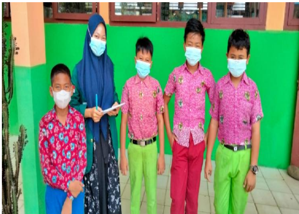
Ket. Gambar 6: Wawancara dengan peserta didik SDN 78 Kota Bengkulu