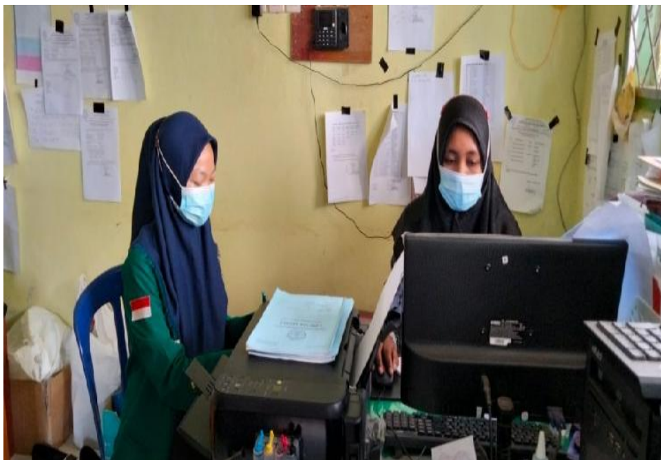
Ket. Gambar 2: Wawancara dengan guru TU di SDN 78 Kota Bengkulu