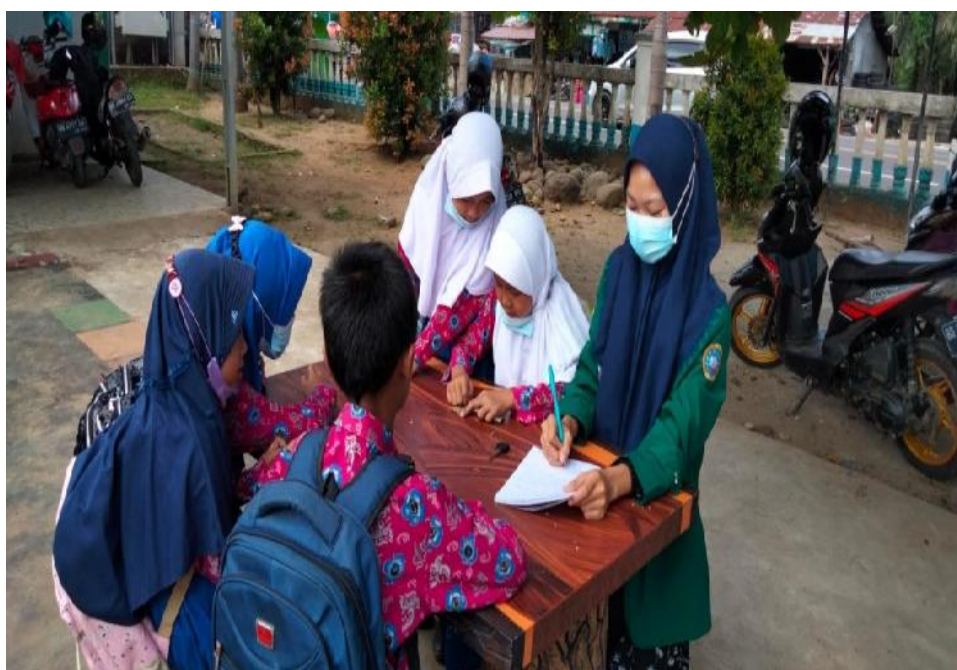
Ket. Gambar 9: Wawancara dengan peserta didik SDN 78 Kota Bengkulu