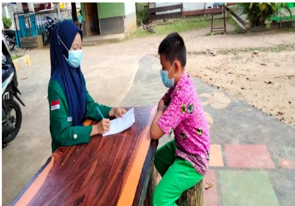
Ket. Gambar 11: Wawancara dengan peserta didik SDN 78 Kota Bengkulu