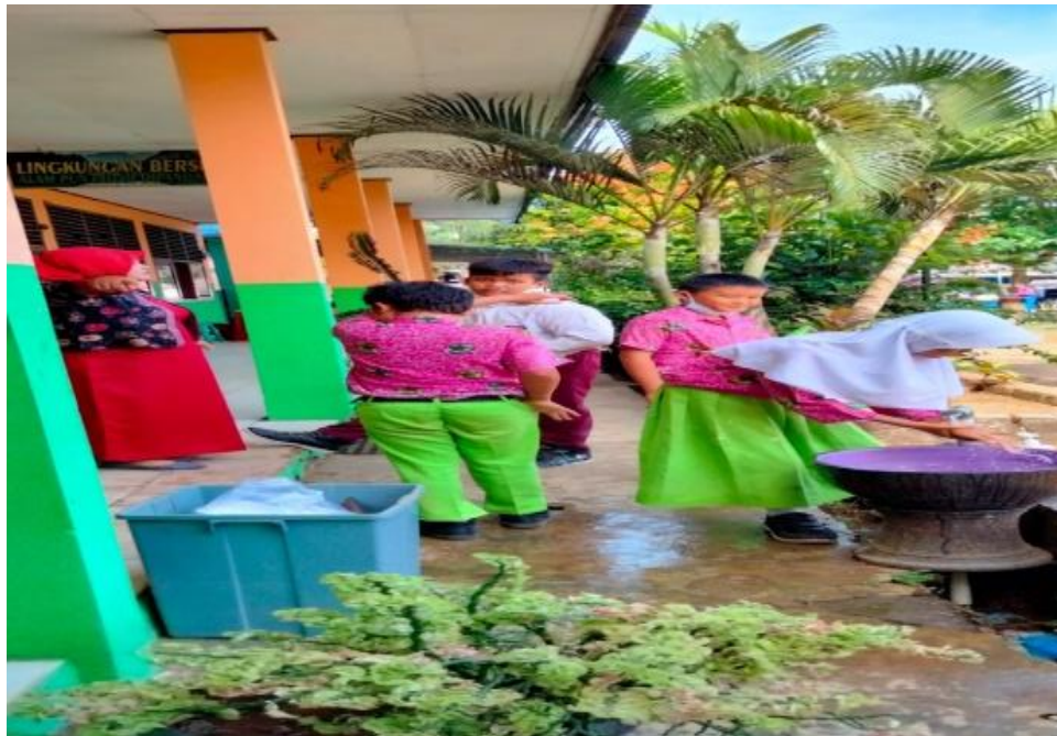
Ket. Gambar 7: dokumentasi peserta didik SDN 78 Kota Bengkulu