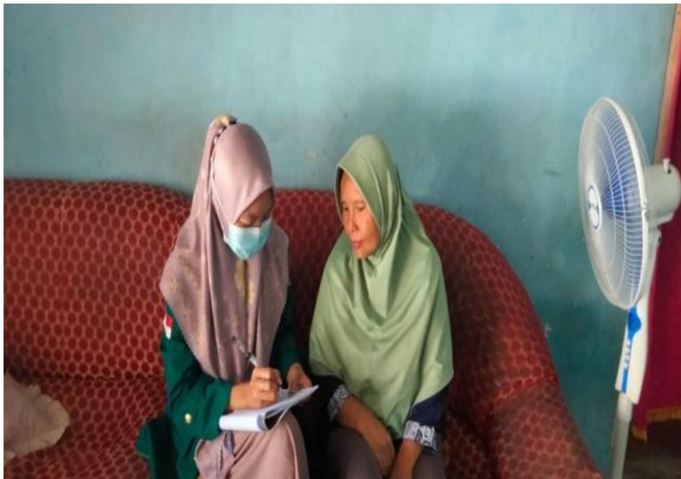
Ket. Gambar 14: Wawancara dengan orang tua peserta didik SDN 78 Kota Bengkulu