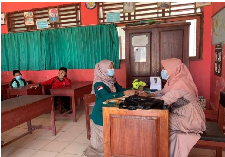
Ket. Gambar 3: Wawancara dengan ibu guru di SDN 78 Kota Bengkulu