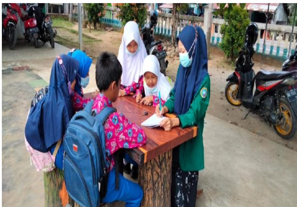
Ket. Gambar 10: Wawancara dengan peserta didik SDN 78 Kota Bengkulu