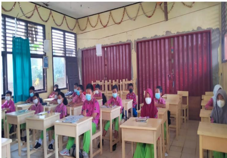
Ket. Gambar 8: dokumentasi peserta didik SDN 78 Kota Bengkulu