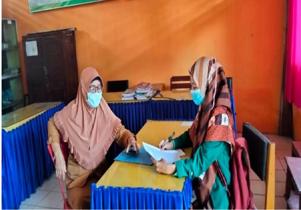
Ket. Gambar 1: Wawancara dengan wali kelas di SDN 78 Kota Bengkulu