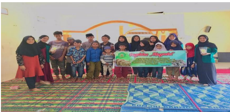
(Dokumentasi kegiatan pelaunching)