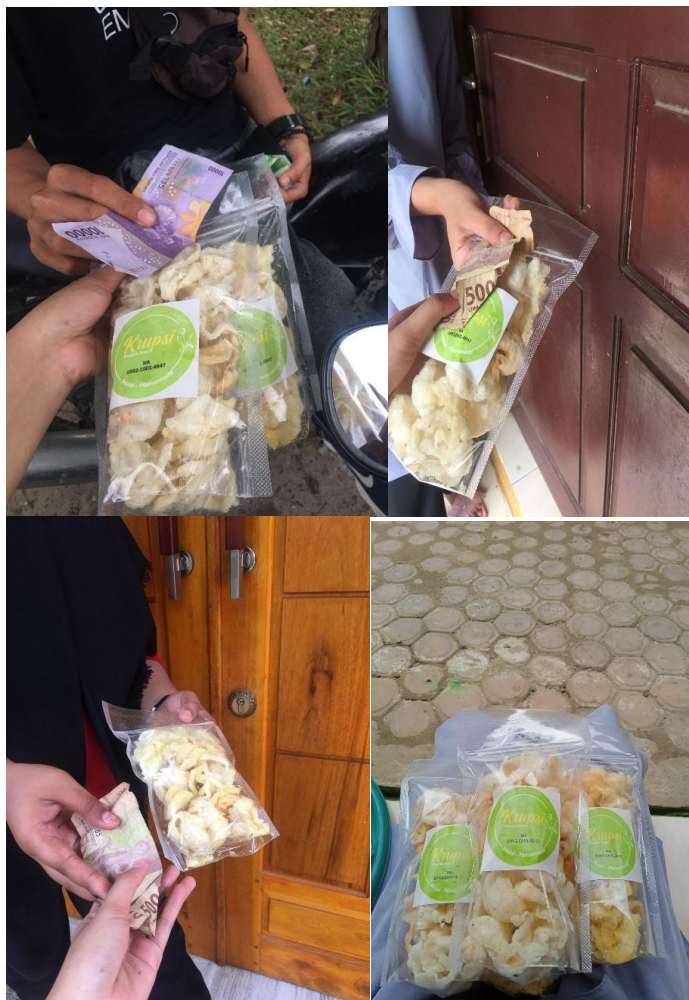
(Dokumentasi pemasaran kerupuk nasi)