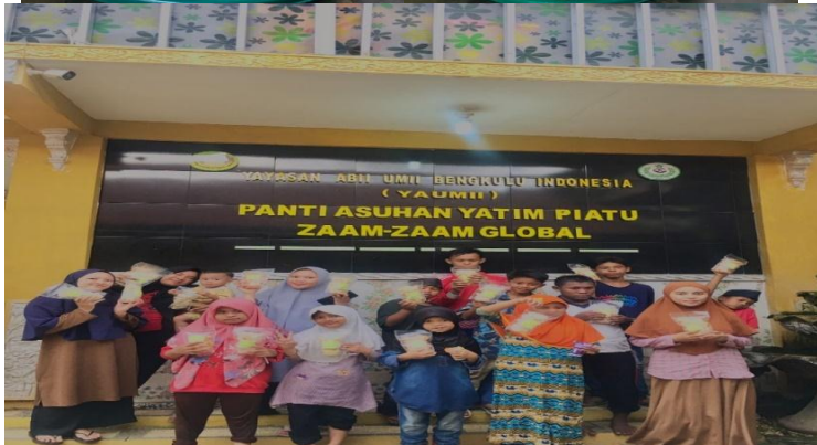
(Dokumentasi pengemasan olahan kerupuk nasi)