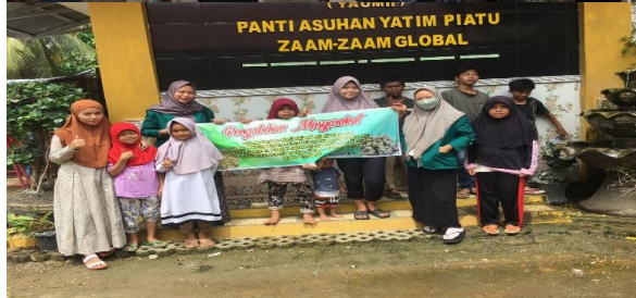
(Dokumentasi penutupan kegiatan pengabdian masyarakat)