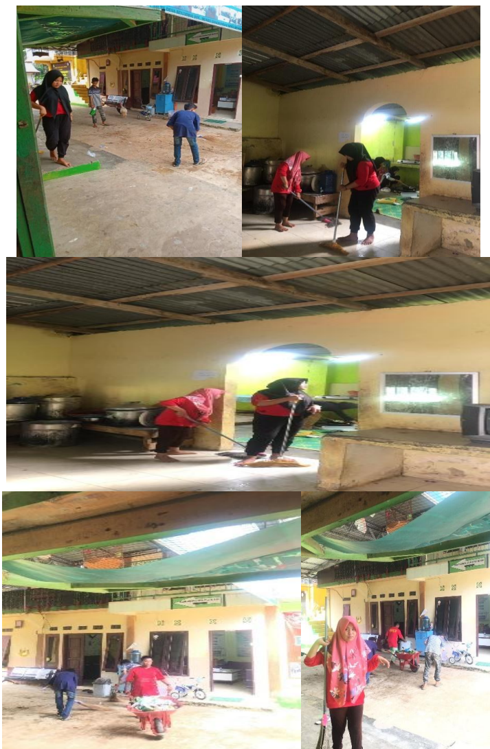
(Dokumentasi kegiatan sosial)