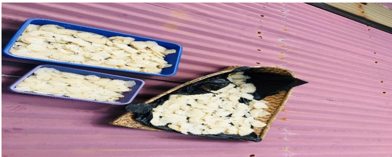
(Dokumentasi proses produksi kerupuk nasi)