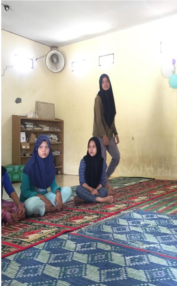
(Dokumentasi penyuluhan kegiatan pengabdian masyarakat)