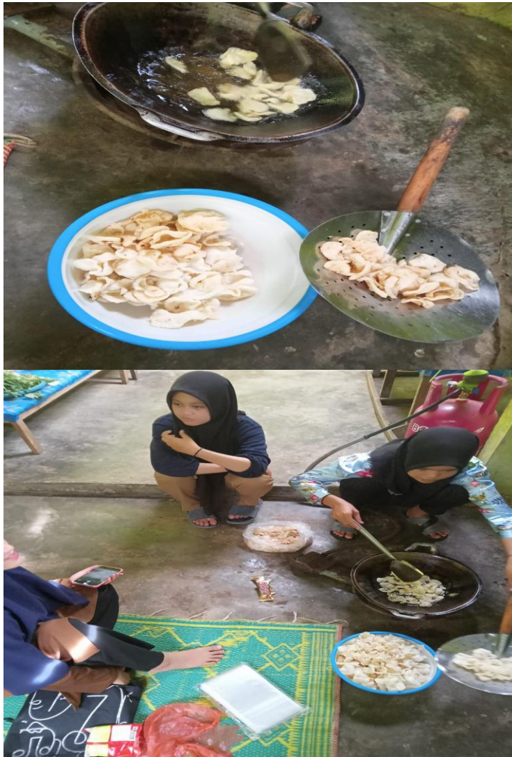
(Dokumentasi proses penggoreng kerupuk)