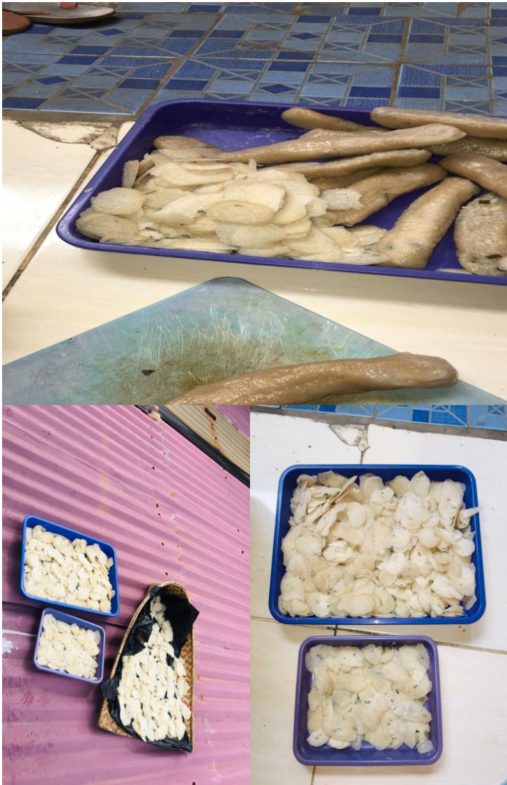
( Dokumentasi proses penjemuran kerupuk)