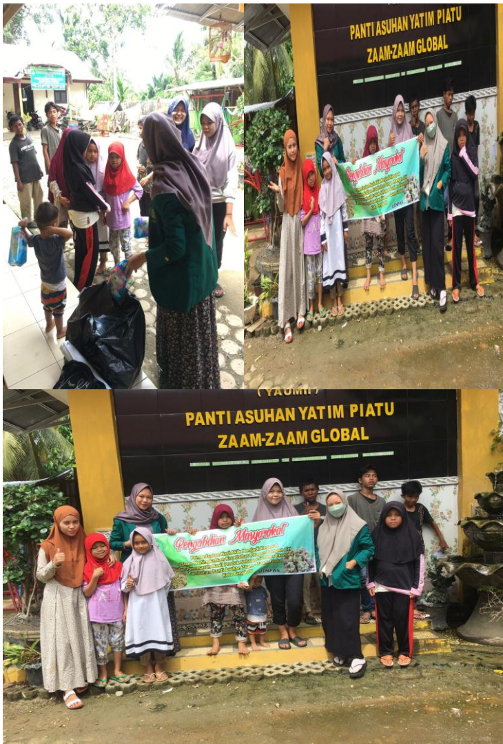
(Dokumentasi penutupan pengabdian masyarakat dip anti asuhan zaam-zaam global Bengkulu )