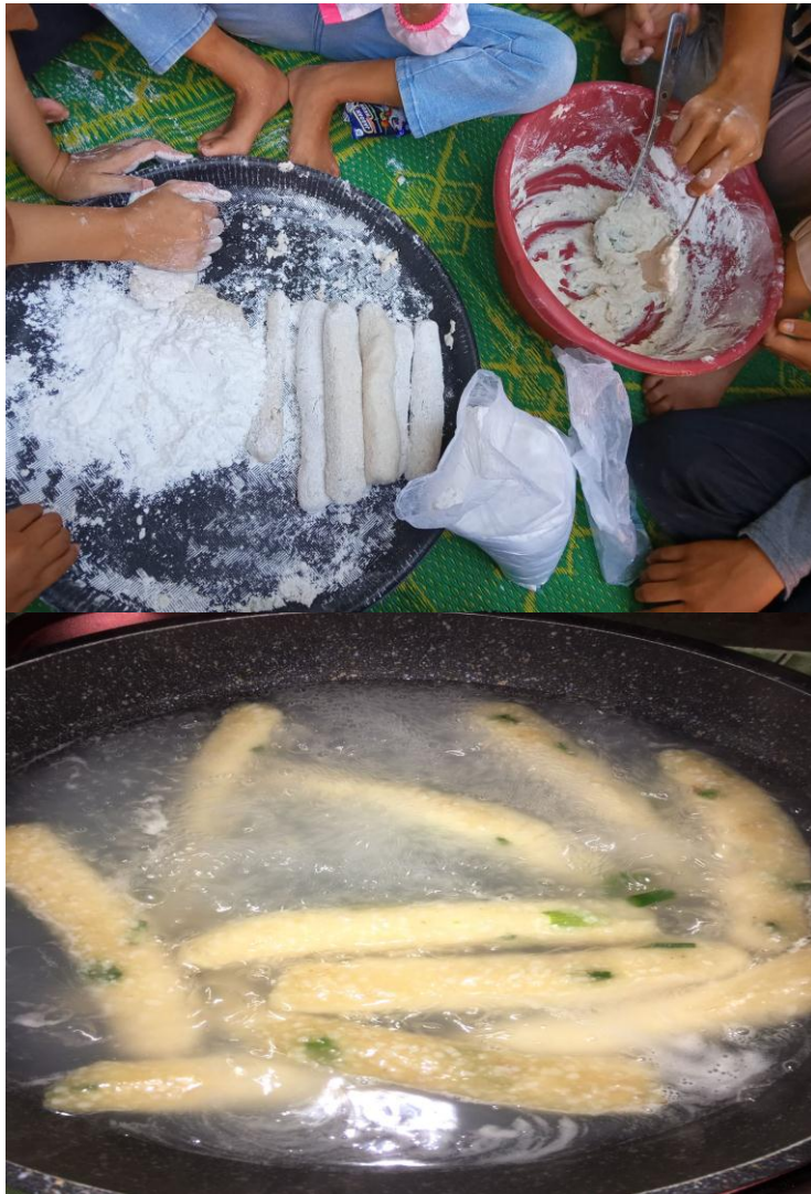
(Dokumentasi proses produksi olahan kerupuk dari nasi aking/)