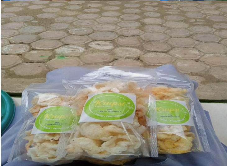
(Dokumentasi pengemasan kerupuk)