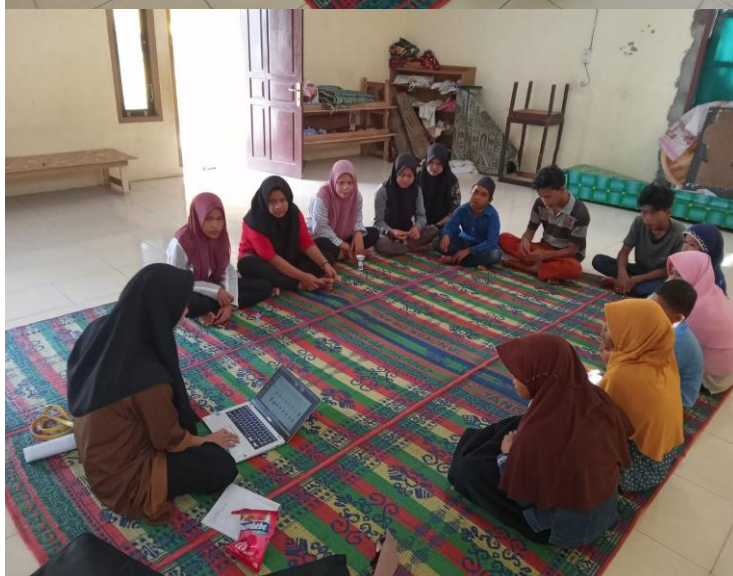
(Dokumentasi penyuluhan program kegiatan )