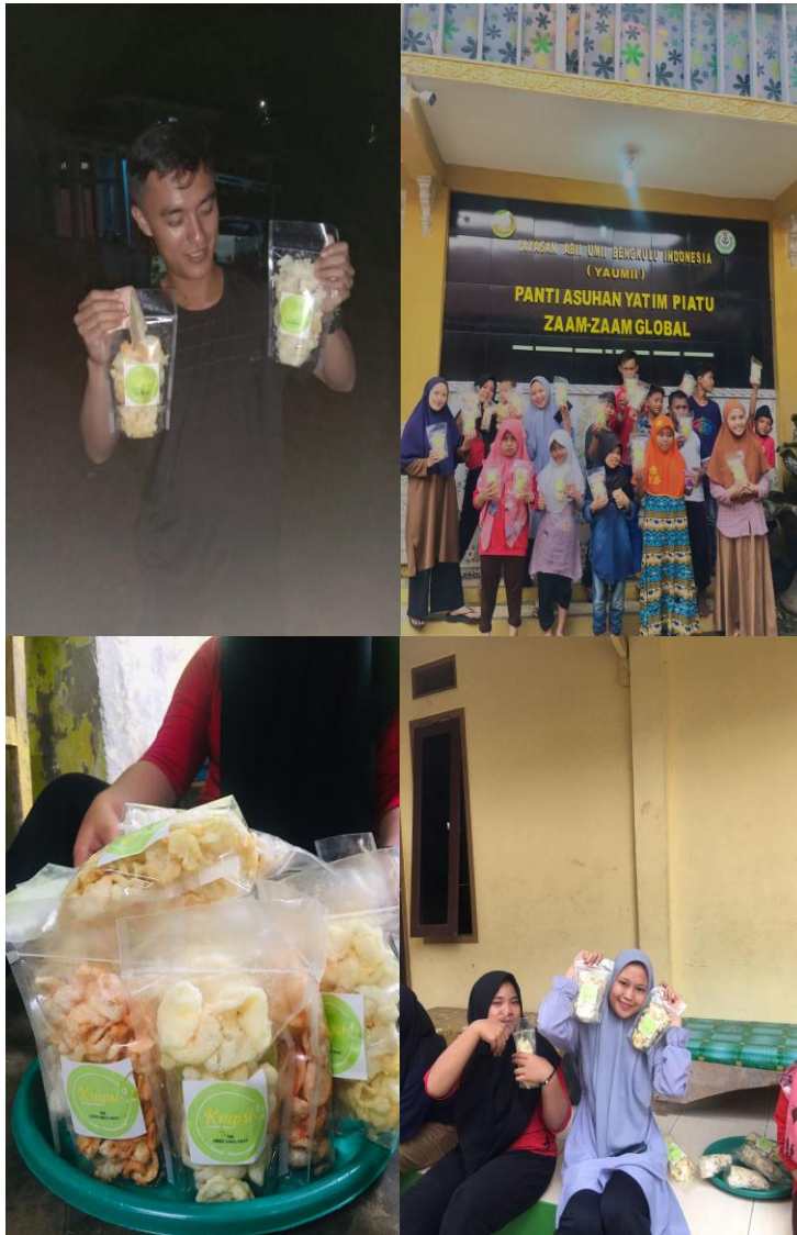
(Dokumentasi pemasaran produk)